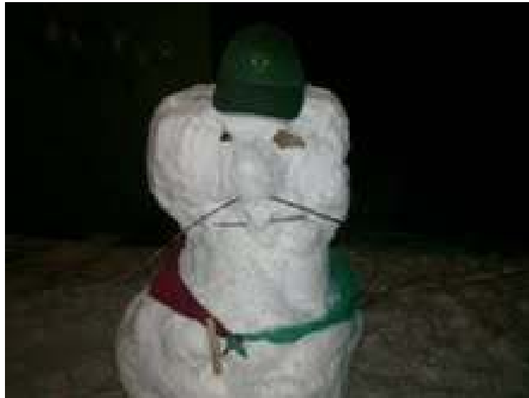
Snemand på Bæver maner