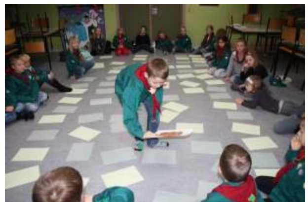
Kæmpe vendespil hos Ulvene