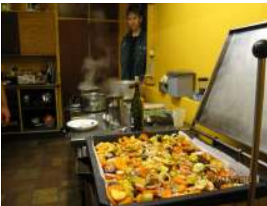
Jule mad på Seniornes juleweekend