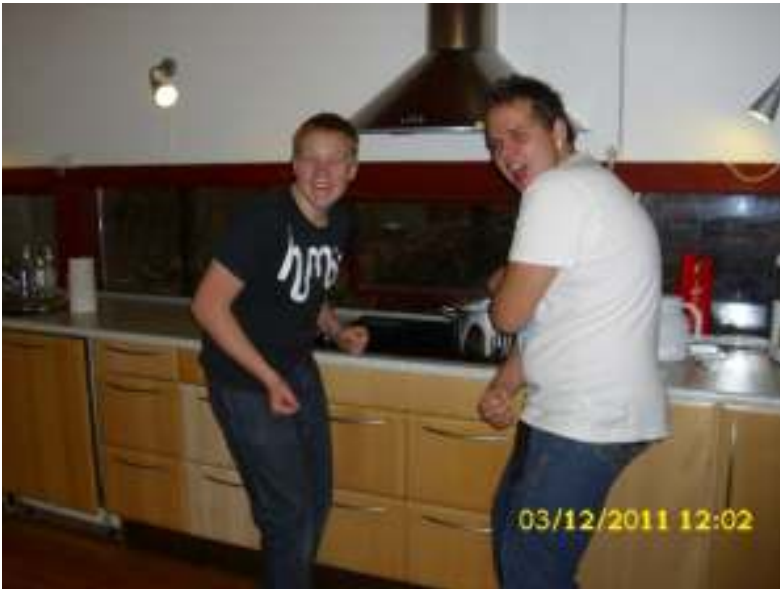
2 gæve gutter i gang med at gøre risengrød hårdere end beton ☺