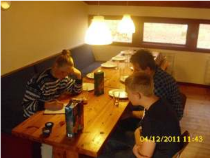
Der bliver skrevet VA-nyt indlæg inden luksus morgenmad